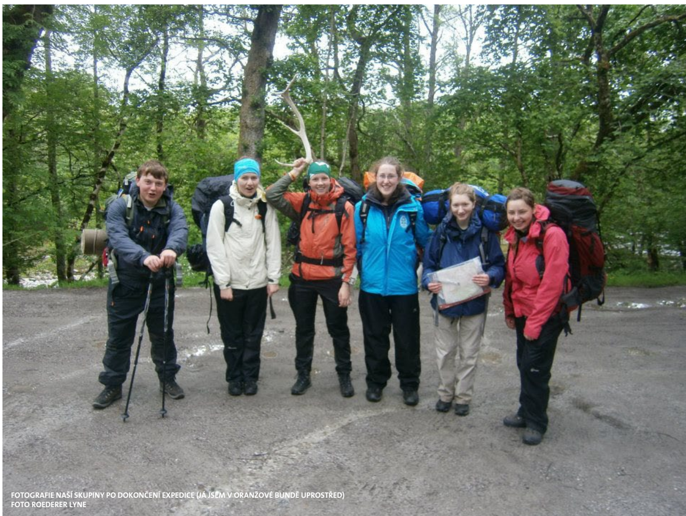
FOTOGRAFIE NAŠÍ SKUPINY PO DOKONČENÍ EXPEDICE (JÁ JSEM V ORANŽOVÉ BUNDĚ UPROSTŘED)

A pokud byste chtěli vědět více o středoškolských stipendiích do Velké Británie a USA tak se můžete podívat na stránkách www.osf.cz .