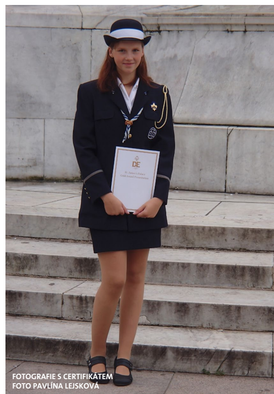
FOTOGRAFIE S CERTIFIKÁTEM

Zaskočena novým prostředím, cizí kulturou a neznámými lidmi, kterým jsem i přes sedm let studia angličtiny moc nerozuměla, jsem usoudila, že nejlépe zapadnu do nové společnosti a zbavím se šíleného stesku po domově skrze známé aktivity. Kontaktovala jsem tedy lokální Girl Guides a pustila se do hledání oddílu orientačního běhu.