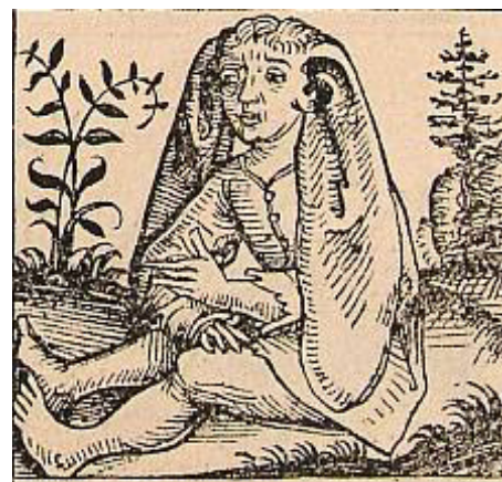
Ušatec z Norimberské kroniky